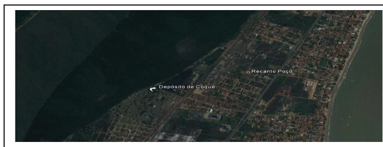
Foto 2. Depósito (área mais escura) localizado a 30m do Rio Paraíba.

Sua população é estimada pelo IBGE (2010) em 57.944 habitantes, com uma densidade habitacional de 1.815,57 hab./Km 2 . O Produto Interno Bruto (PIB) municipal possui um valor de R$2.184.283,943, e o PIB per capita possui um valor de R$42.775,42, o maior da Paraíba (IBGE: 2010). Tal condição é alcançada graças à existência do Porto de Cabedelo, única via náutica de circulação comercial nos limites do Estado.