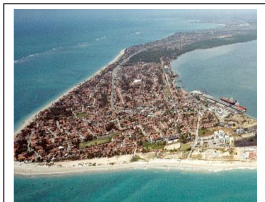
Foto 1. Vista Aérea da cidade de Cabedelo.

O município de Cabedelo está localizado na mesorregião da Mata Paraibana (IBGE: 2008) no litoral da Paraíba. Faz parte da região metropolitana de João Pessoa e limita-se com o Oceano Atlântico e com os municípios de Lucena, João Pessoa e Santa Rita. Possui uma área aproximada de 31,9km 2 (IDEM).