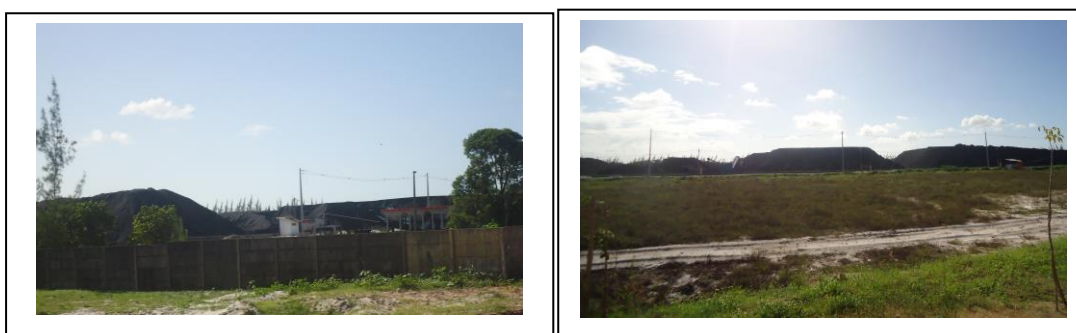
Fotos 5 e 6. Depósito de coque em Cabedelo-PB.

A partir do exame documental, buscou-se o entendimento analítico do problema, ou seja; identificar para além das aparências ou da simples descrição dos acontecimentos a lógica geral de seu desenvolvimento.