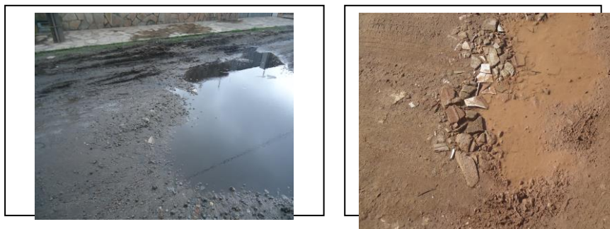
Fotos 3 e 4: Contraste entre o solo no local do depósito (foto 3) e o solo de uma rua próxima (foto 4) em Cabedelo-PB.

No ano de dois mil e um (2001), instalou-se no município de Cabedelo-PB, a empresa Terminal de Combustíveis da Paraíba (TECOP), empresa brasileira especializada no beneficiamento, armazenamento e comercialização de petcoque e carvão mineral. Possuindo como um dos seus principais acionistas a Oxbow Corporation ou Oxbow Group – a maior distribuidora de petcoque do planeta com atuação global e faturamento de 3,7 bilhões de dólares/anos – a empresa mantém como atividade principal a importação de coque de petróleo originário dos Estados Unidos da América e Venezuela. O transporte do material é realizado por via náutica e recebido pelo porto de Cabedelo. Neste mesmo município, o combustível fica armazenado até seu traslado definitivo, para o consumidor final.